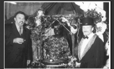
Wenn Aldiana kommt ...