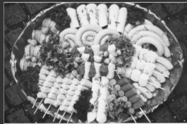
Aufgespiesst zum OpenAir