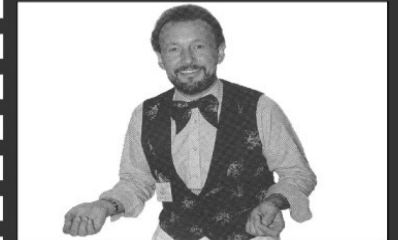
Spezi - der "Gottschalk" des Kulinariums