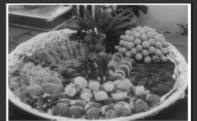
Da gibt's noch echte "Handarbeit"

Alle kulinarischen Genüsse vereinen sich in einem neuen "Feinschmecker-Konzept" für bewusstes Genießen.